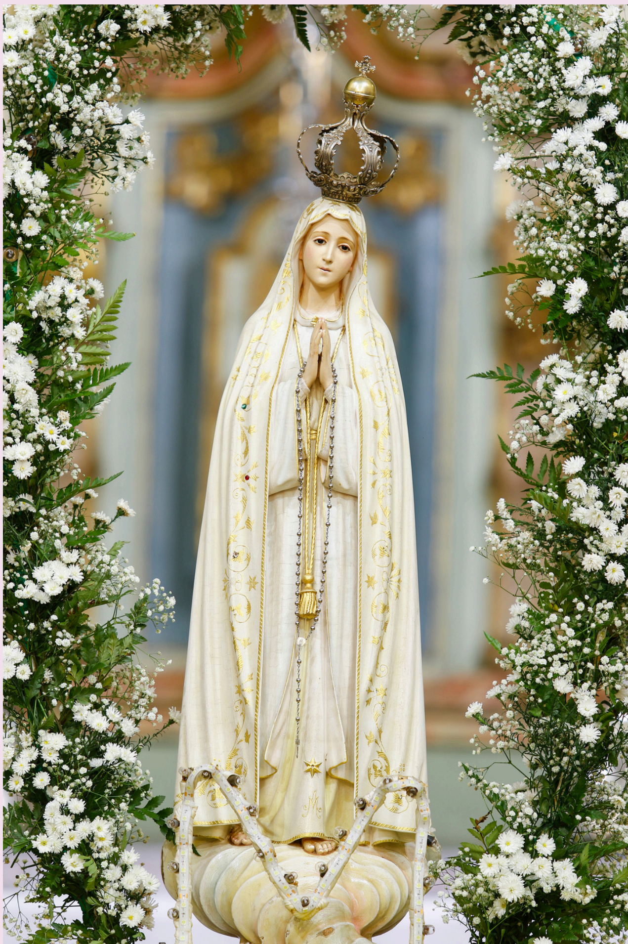
Rosário de Mãe Maria